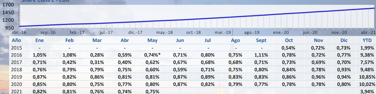
Share Class E - EUR

*Oct 2015-Apr 2016 Class A. Performance from May 2016 Class E