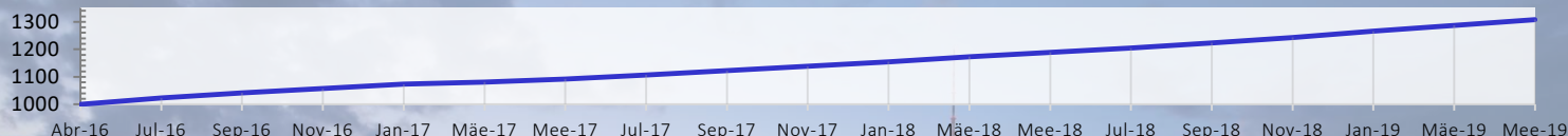
Share Class E - EUR

The Marshall Bridging Fund (MBF) ofrece a los inversores acceso a seguros y predecibles retornos generados a partir de la financiación a corto plazo en proyectos de propiedad con base en Europa. La rentabilidad del fondo no depende de alzas en el valor de la propiedad, y por lo tanto no se ve afectada por la volatilidad que puede ocurrir a corto plazo en los valores de las mismas.