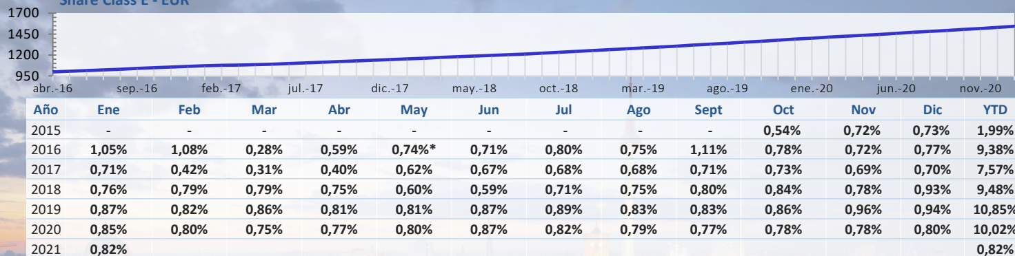
Share Class E - EUR

* Oct 2015-Apr 2016 Class A. Performance from May 2016 Class E