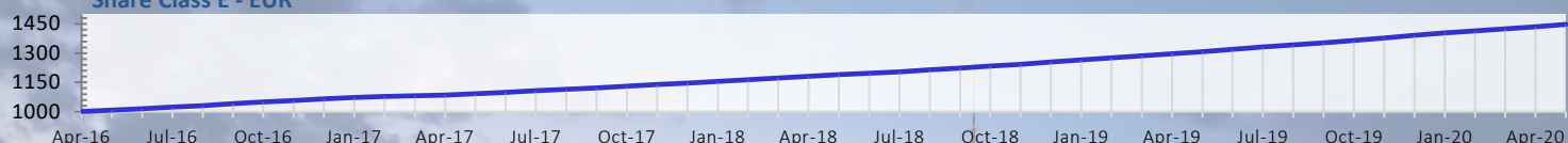
Share Class E - EUR

The Marshall Bridging Fund (MBF) ofrece a los inversores acceso a seguros y predecibles retornos generados a partir de la financiación a corto plazo en proyectos de propiedad con base en Europa. La rentabilidad del fondo no depende de alzas en el valor de la propiedad, y por lo tanto no se ve afectada por la volatilidad que puede ocurrir a corto plazo en los valores de las mismas.