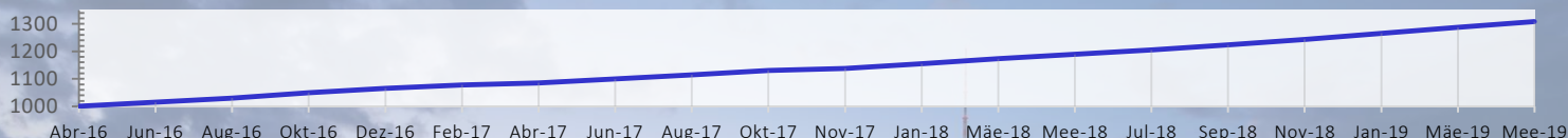
Anteilklasse E – EUR

Der Marshall Bridging Fund (MBF) bietet Anlegern die Möglichkeit, sichere und voraussehbare Renditen zu erzielen aus der kurzfristigen Finanzierung von Immobilienprojekten in größeren europäischen Städten mit Hauptaugenmerk auf Deutschland. Die Renditen des Fonds hängen nicht von der Wertsteigerung von Immobilien ab. Daher bleiben sie unberührt von der kurzfristigen Volatilität der Immobilienpreise.