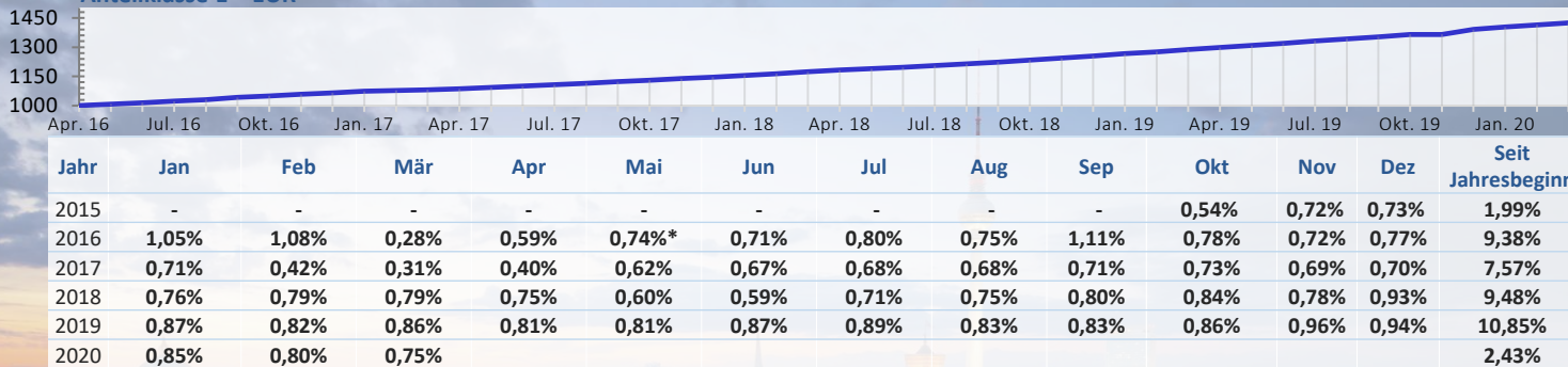
Anteilklasse E – EUR

*Okt 2015 - Apr 2016 Klasse A. Performance ab Mai 2016 Klasse E