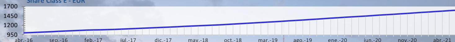
Share Class E - EUR

The Marshall Bridging Fund (MBF) ofrece a los inversores acceso a seguros y predecibles retornos generados a partir de la financiación a corto plazo en proyectos de propiedad con base en Europa. La rentabilidad del fondo no depende de alzas en el valor de la propiedad, y por lo tanto no se ve afectada por la volatilidad que puede ocurrir a corto plazo en los valores de las mismas.