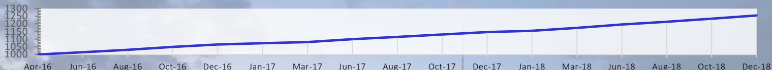
Share Class E - EUR

The Marshall Bridging Fund (MBF) ofrece a los inversores acceso a seguros y predecibles retornos generados a partir de la financiación a corto plazo en proyectos de propiedad con base en Europa. La rentabilidad del fondo no depende de alzas en el valor de la propiedad, y por lo tanto no se ve afectada por la volatilidad que puede ocurrir a corto plazo en los valores de las mismas.