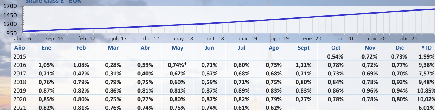
Share Class E - EUR

*Oct 2015-Apr 2016 Class A. Performance from May 2016 Class E