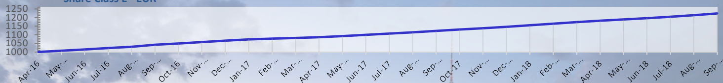
Share Class E - EUR

The Marshall Bridging Fund (MBF) ofrece a los inversores acceso a seguros y predecibles retornos generados a partir de la financiación a corto plazo en proyectos de propiedad con base en Europa. La rentabilidad del fondo no depende de alzas en el valor de la propiedad, y por lo tanto no se ve afectada por la volatilidad que puede ocurrir a corto plazo en los valores de las mismas.