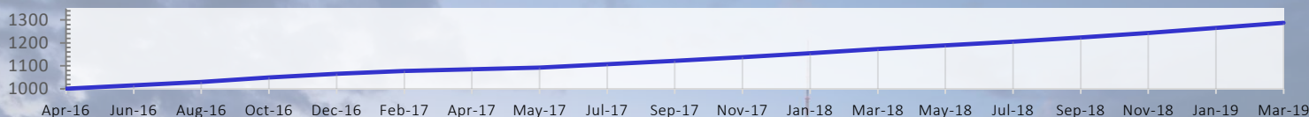
Anteilklasse E – EUR

Der Marshall Bridging Fund (MBF) bietet Anlegern die Möglichkeit, sichere und voraussehbare Renditen zu erzielen aus der kurzfristigen Finanzierung von Immobilienprojekten in größeren europäischen Städten mit Hauptaugenmerk auf Deutschland. Die Renditen des Fonds hängen nicht von der Wertsteigerung von Immobilien ab. Daher bleiben sie unberührt von der kurzfristigen Volatilität der Immobilienpreise.